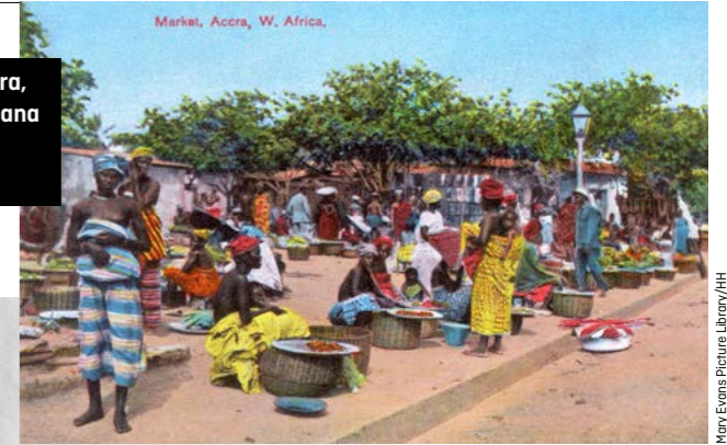
1910: straatmarkt in Accra, hoofdstad van wat nu Ghana is, en destijds de Britse kolonie Goudkust

Afgezwakte beweringen dat het kolonialisme 'niet in alle opzichten slecht was', vallen bij hem ook verkeerd. Dat is wat hij the