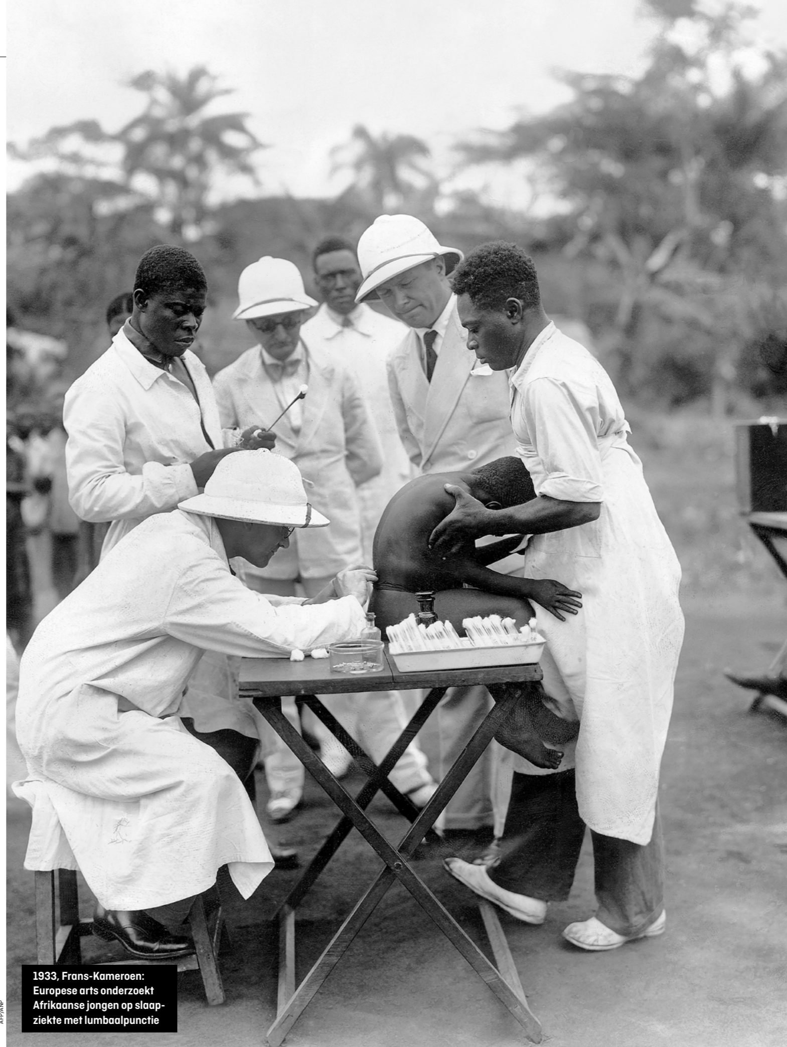
1933, Frans-Kameroen: Europese arts onderzoekt Afrikaanse jongen op slaapziekte met lumbaalpunctie

kansen die ze anders niet hadden gekregen en zorgde ook in veel andere opzichten voor sociale, politieke en economische vooruitgang. 'Het Britse koloniale rijk heeft meer voor de bestrijding van armoede gedaan dan alle ontwikke-