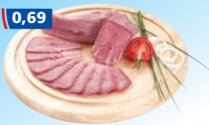
Gekochte Schweinezunge 100 g