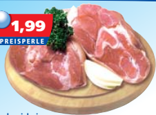
Vordereisbein frisch oder gepökelt 1 kg