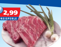
Schälrippchen 1 kg