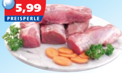
Schweinefiletköpfe 1 kg