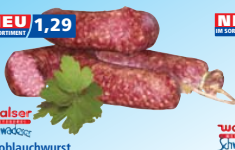
walser Schwäbische Knoblauchwurst im Ring 100 g