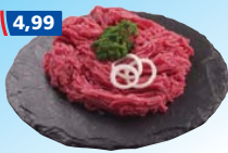
Gewiegtes vom Rind 1 kg