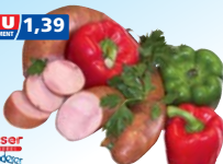
walser Schwäbische Schinkenkrakauer 100 g