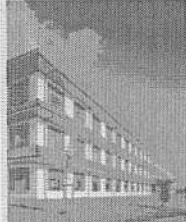
Produktionsgebäude in St. Katharinen/Rheinl.-Pfalz