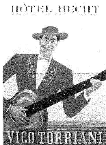
Werbeplakat 1950 (gemalt von Erich Dittmann)