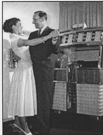
Die Musikbox ersetzt das Tanzorchester.

Das Publikum ist begeistert. Und das Gerät wird weiter entwickelt.