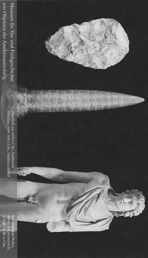
Säulensockel von Isis v. Chr., Fankesch, Götterkult, 1000-800 v. Chr., Süddeutschland