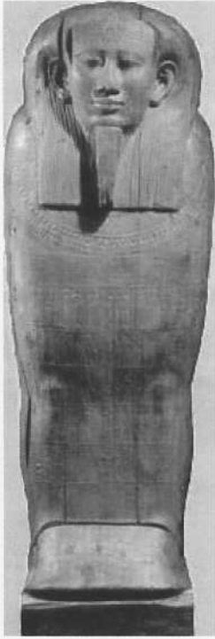
University of Leipzig Artifact