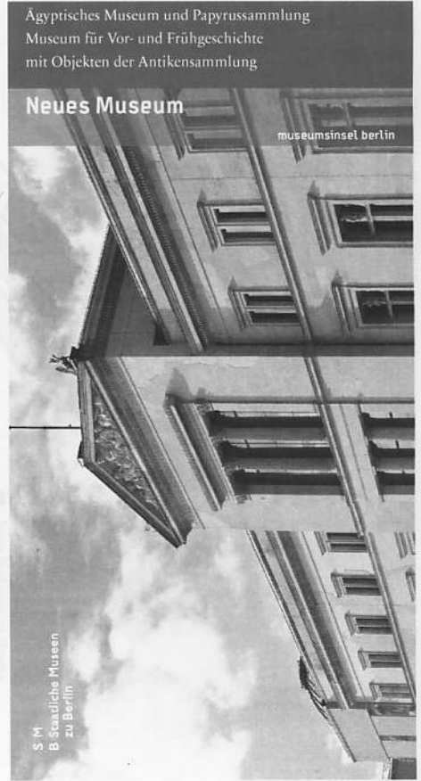
S M B Städtische Museen zu Berlin

Zwischen 1843 und 1855 nach Plänen Friedrich August Stülers errichtet, stellt das Neue Museum ein Hauptwerk der Kunst-, Museums- und Technikgeschichte des 19. Jahrhunderts dar. Nach 70-jähriger Schließung ist es für Besucherinnen und Besucher seit Oktober 2009 wieder zugänglich. Schwere Zerstörungen erlitt das Bauwerk im Zweiten Weltkrieg bei massiven Bombeneinschlägen. In den folgenden vierzig Jahren blieb die Kriegertrümme den schädlichen Witterungseinflüssen ausgesetzt – eine erste Notstichung erfolgte erst in den 1980er Jahren. Als Ergebnis eines internationalen Restaurierungswettbewerbs erhielt der britische Architekt David Chipperfield 1997 den Auftrag, das Museumsgebäude wieder in den ursprünglichen Zustand zu versetzen. Die Bauarbeiten begannen 2003. Unter Beachtung hoher denkmalpflegerischer Auflagen galt es, dem seit 1999 zum UNESCO-Weltkulturerbe gehörenden Bau wieder seinen ursprünglichen Glanz zu verleihen. Dieser Herausforderung begegnete der Architekt mit einer bravourösen Einbettung des Museumsrestos in die Architektursprache unserer Zeit.