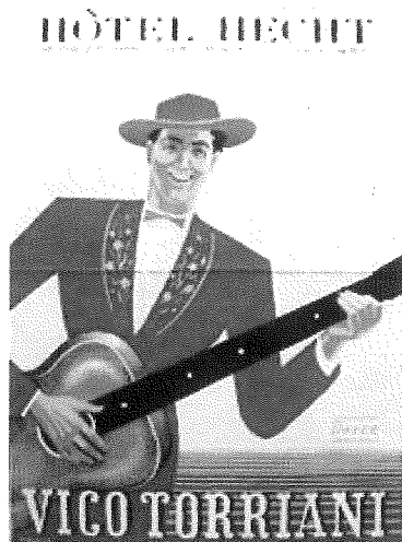
Werbeplakat 1950 (gemalt von Erich Dittmann)